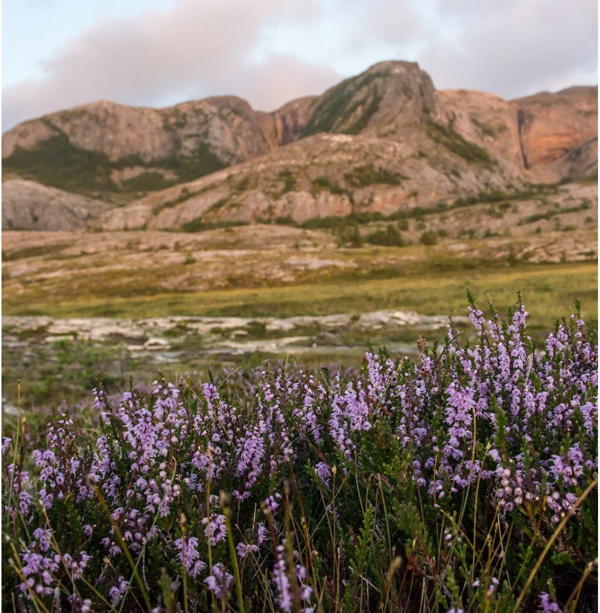
Kommuneblomsten røsslyng