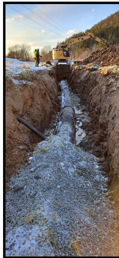
Bilde 6: Grøfting og hydrotekniske tiltak styrker produksjonsgrunnlaget, reduserer risiko for erosjon og vannskader, og gjør landbruket bedre rustet for mer krevende værforhold.

De økonomiske virkemidlene blir derfor svært viktige. Produksjonstilskudd, beitetilskudd, avløserordninger og investeringstilskudd er avgjørende for mange bruk i kommunen. Det gjelder særlig for melk, storfe og sau, som er viktige produksjoner i Åfjord. Tilskudd til drenering, hydroteknikk, miljøtiltak og skogbruk kan også gjøre det mulig å gjennomføre tiltak som ellers ville vært vanskelige å finansiere.