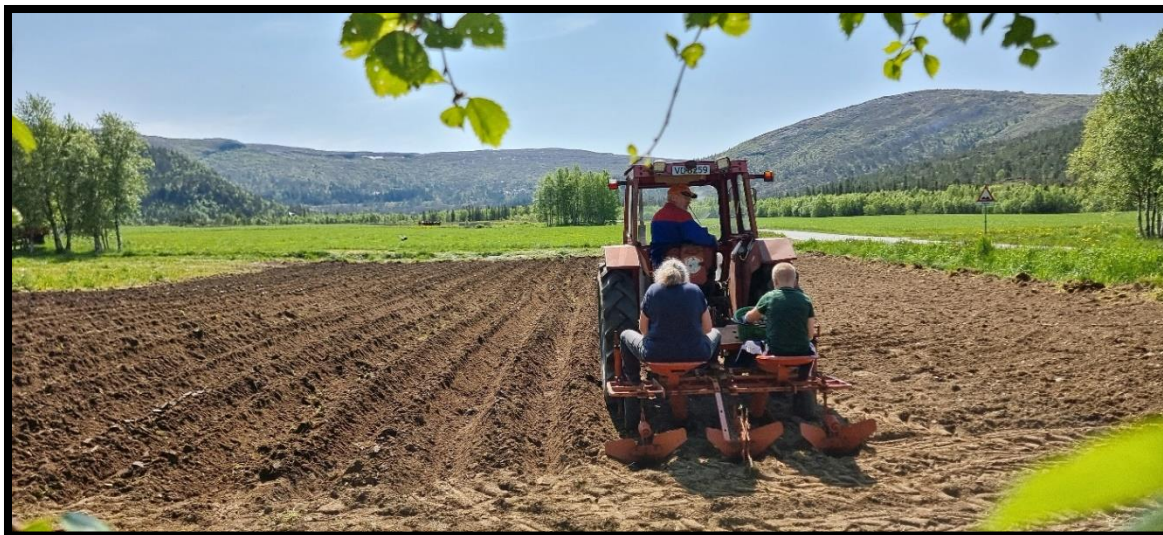
Bilde 7: Potetsetting på tvers av generasjoner viser hvordan praktisk kunnskap, arbeidslyst og tilhørighet til gården føres videre.

For bønder som står foran generasjonsskifte eller vurderer å satse videre, gir utviklingen bedre muligheter for investering og modernisering. Samtidig blir det viktig å planlegge tidlig og ha god dialog med kommunen og rådgivingsmiljøene. Det gjelder særlig ved ombygging, nybygg og tiltak som krever søknad eller tilskudd.