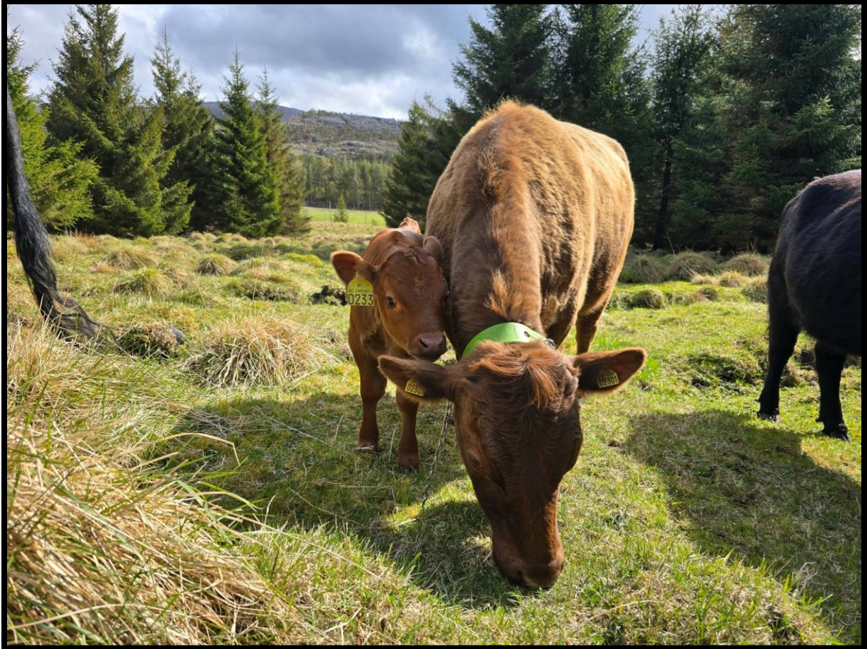
Bilde 2: Utmarksbeite er et eksempel på bruk av lokale ressurser til matproduksjon, kulturlandskap og beredskap.

De internasjonale avtalene setter de ytre rammene for norsk landbrukspolitikk. Innenfor disse rammene utformes de nasjonale målsettingene og virkemidlene som kommunen møter i sitt daglige arbeid.