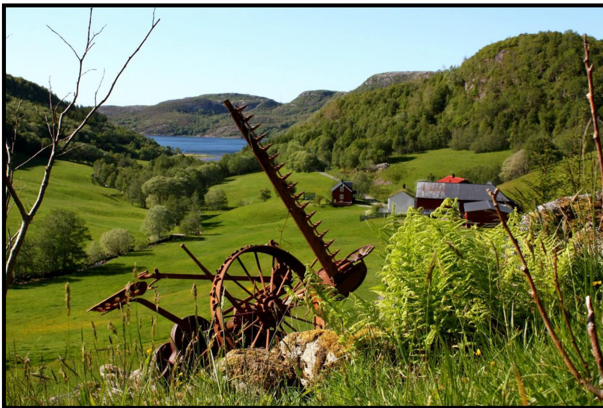
Bilde 1: Kulturlandskap i Åfjord – der jord, skog, utmark og bosetting inngår i samme ressursgrunnlag.