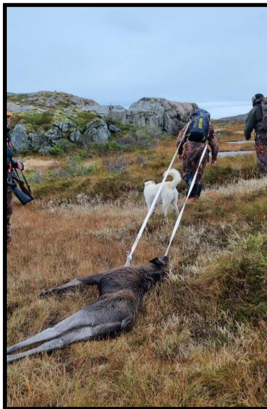
Bilde 4: Utmarksressursene er en del av Åfjord sin matberedskap og langsiktige ressursgrunnlag.

Kulturminneloven skal sikre vern av kulturminner og kulturmiljøer og er særlig relevant ved tiltak som nydyrking, skogsdrift og vegbygging.