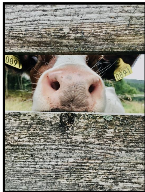
Bilde 5: Landbruket handler også om nærhet til dyra, daglig omsorg og små øyeblikk som skaper glede i hverdagen.